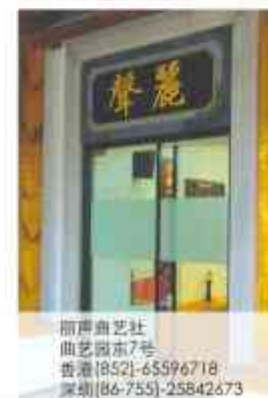
应星曲艺社 曲艺园东7号 香港(852)-65996718 深圳(86-755)-25842673