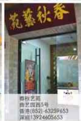
春秋艺苑 曲艺园西3号 香港(852)-63259653 深圳13924605653