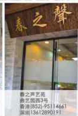
春之声艺苑 曲艺园西3号 香港(852)-95114661 深圳13612890191