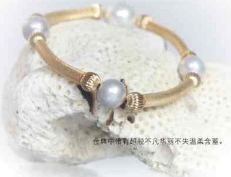
金典中带有超脱不凡华丽不失温柔含蓄。