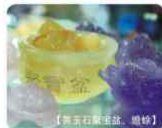
【黄水晶聚宝盆、貔貅】

粉晶如意寿桃：粉晶是爱情宝石的第一品牌，可以增强自身气场里的粉红光，粉红光也是阿佛罗狄(爱之女神维纳斯)显示爱的颜色。桃为桃李满园寿比南山，用粉水晶制作就预示了爱情能与恋人开花结果，爱情的生命力强，和配偶白头偕老，送给爱人的不二之选。