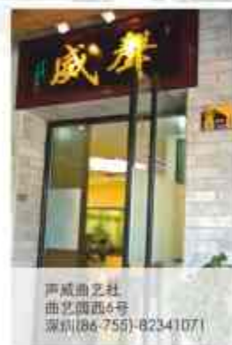
应星曲艺社 曲艺园西4号 深圳(86-755)-82341071