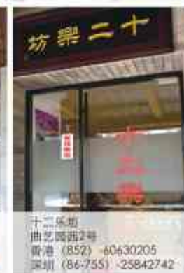
十二乐坊 曲艺园西2号 香港(852)-60430205 深圳(86-755)-25842742