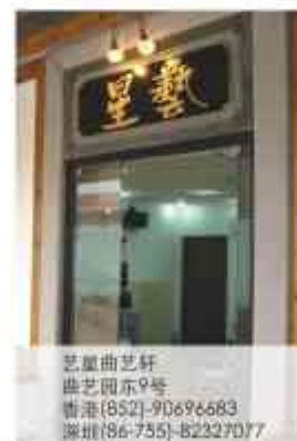
应星曲艺轩 曲艺园东9号 香港(852)-90696683 深圳(86-755)-82327077