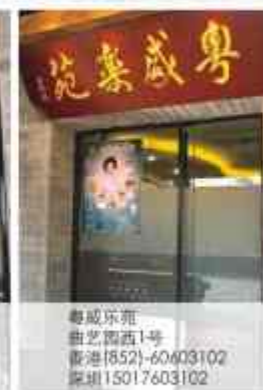
粤威乐苑 曲艺园西1号 香港(852)-60403102 深圳15017603102