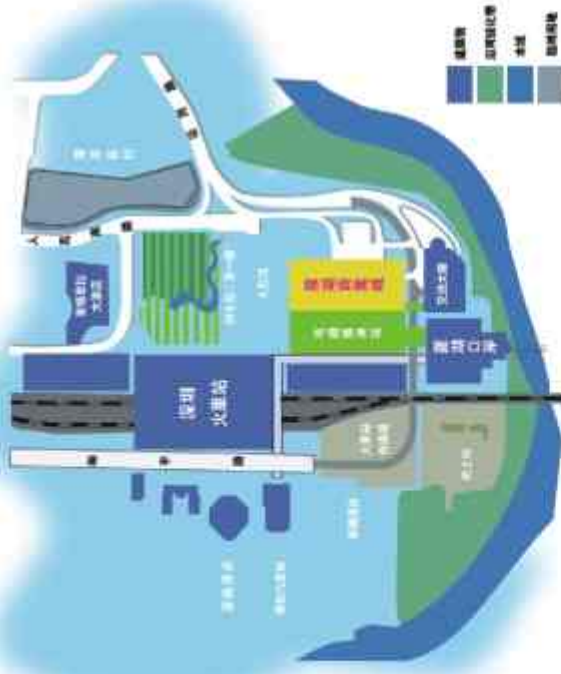
罗湖商业城平面图