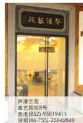
应星曲艺苑 曲艺园东8号 香港(852)-95819411 深圳(86-755)-25842848